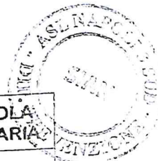
TABELLE DIETETICHE Terza settimana