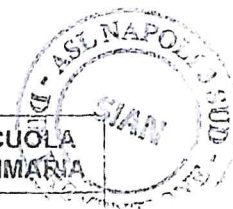
TABELLE DIETETICHE Prima settimana

Via Montedoro 47 - Torre del Greco (NA) Tel. 081/8490160 - 0113 E-mail siaen@pec.aslnapoli3sud.it Sito: www.aslnapoli3sud.it