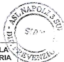
TABELLE DIETETICHE Prima settimana