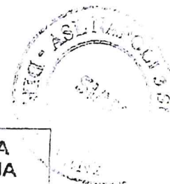
TABELLE DIETETICHE Quarta settimana