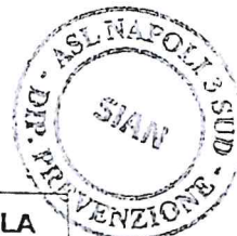
TABELLE DIETETICHE Seconda settimana

Direttore: Dott. Pierluigi Piccirilli Via Montedoro 47 - Torre del Greco (NA) Tel. 081/8490160 - 0159 E-mail siaen@pec.aslnapoli3sud.it Sito: www.aslnapoli3sud.it